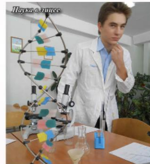
Наука в лицее

По нашему мнению, эффективная образовательная коммуникация – способность всех участников образовательного процесса в активном диалоге («на понятном всем субъектам языке») проводить анализ Политики и целей на предмет их пригодности и актуализации, в активном диалоге апробировать практику ФГОС, при этом определять недостающие ресурсы, в режиме коллегиальности и профессионального договора улучшать систему менеджмента качества на основе реализации принципов инновационного менеджмента в образовании.