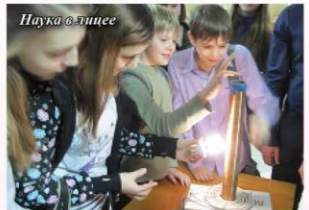
Наука в лицее

● Лауреат регионального Конкурса «Лучший сайт ОУ».