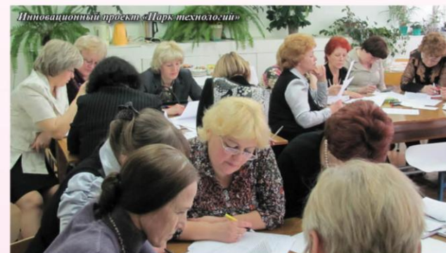
Инновационный проект «Парк технологий»