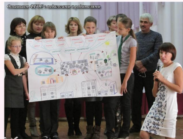
Осваивает ФГОС с педагогами и родителями